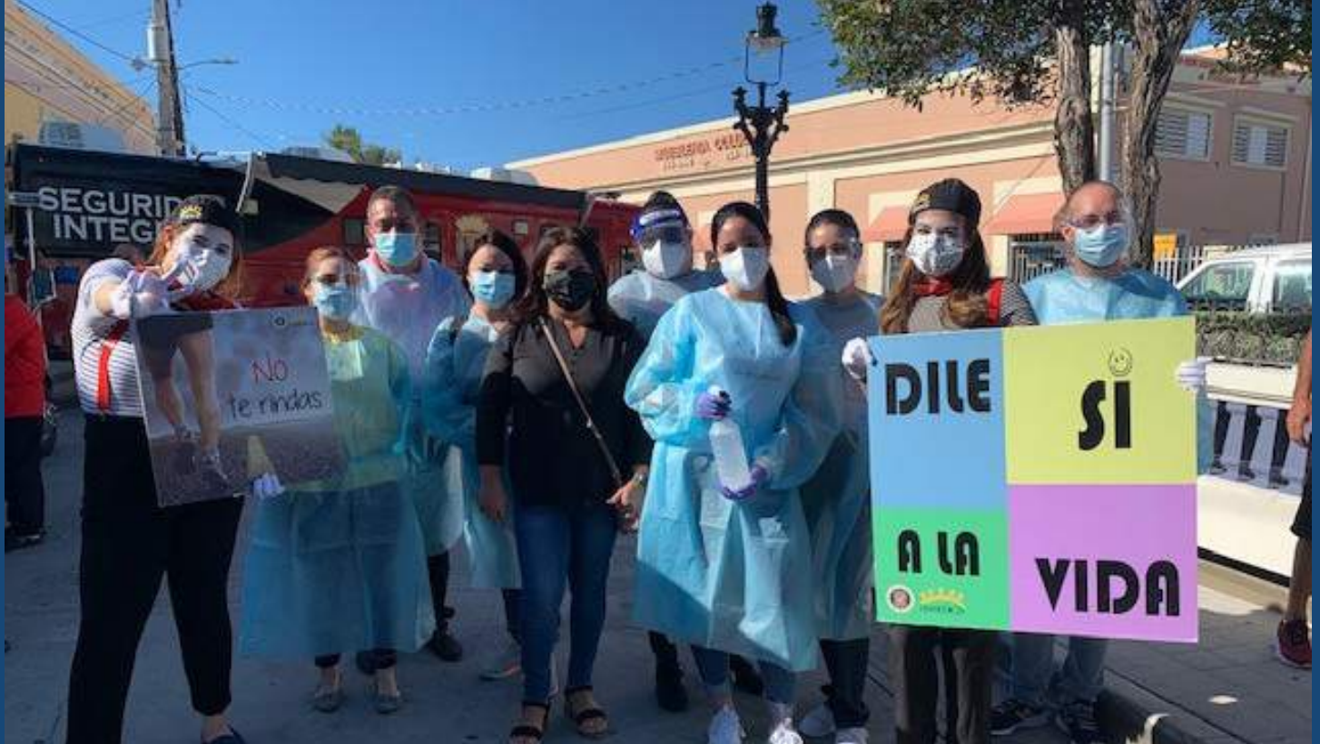
Cambiando Vidas se celebró el pasado 11 de marzo de 2021 en la Plaza Domingo Cruz en Ponce.

Estudiantes de Maestría en Trabajo Social Clínico dan la mano a los más vulnerables