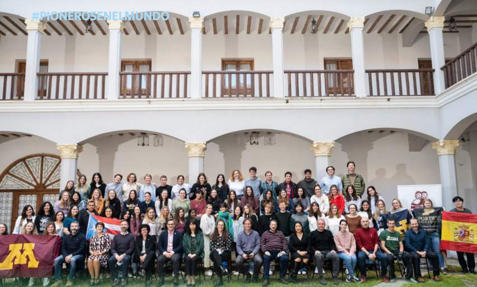
...viene de la página anterior

que había gastado esas primeras 2 semanas apunté en la columna de personal cuánto gastarían por mes. En la columna de viajes destiné una cantidad mayor de dinero y con los destinos que quería visitar. Y en salidas, pues, cuánto gastarían cada semana en buses, comidas fuera de la Fundación, bares, discotecas, taxis, museos y actividades de recreación y ocio. Este método me funcionó bastante bien. De hecho, me sobró dinero” indicó.