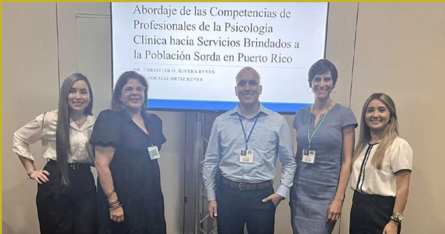
Miembros de la comunidad universitaria del recinto de Arecibo participaron en la Convención de la Asociación de Psicología de Puerto Rico.

En el evento participaron miembros de la comunidad universitaria del recinto de Arecibo