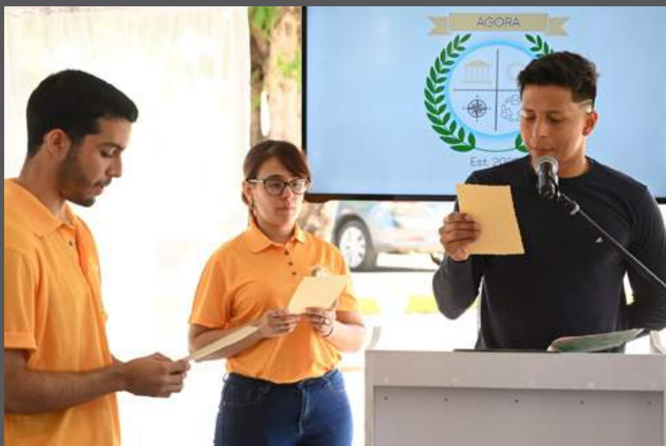
La iniciativa forma parte de la Carpa del Encuentro y promueve el diálogo entre los jóvenes universitarios.

sobre todas las cosas, ser escuchado y que le permite a la comunidad universitaria expresarse y dar el primer paso a un diálogo continuo. Este primer paso fue fundamental