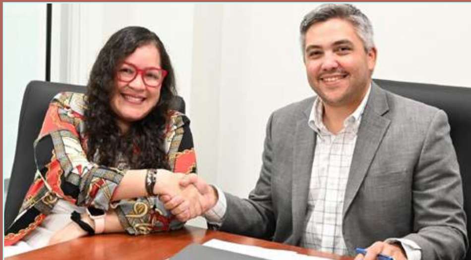
Los estudiantes que se acojan al programa combinado terminan ambos grados simultáneamente: el Juris Doctor y la Maestría en Ciencias Sociales con especialidad en Criminología o Administración Pública.