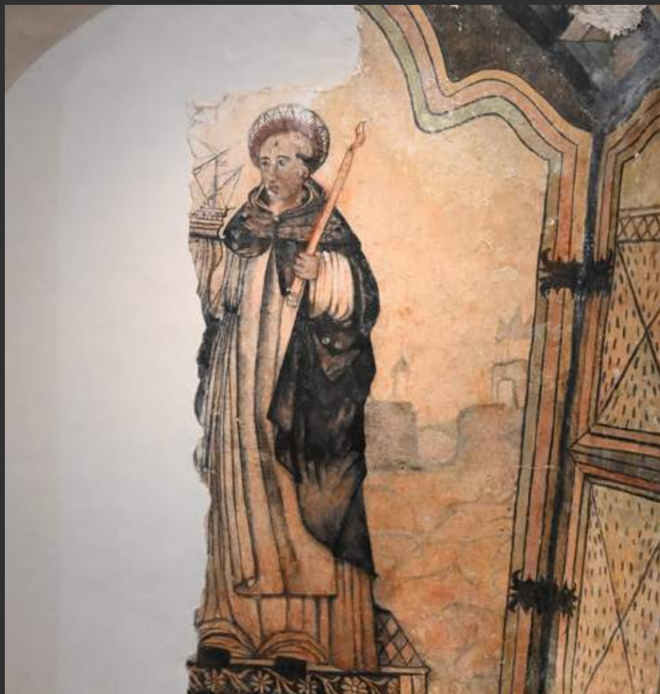
La pintura de san Telmo data de antes de 1534.

San Telmo posiblemente se identifica con el fraile Pedro González, un